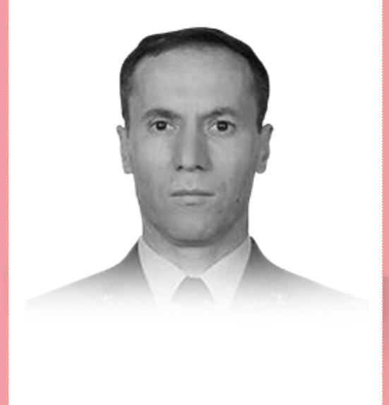
SAYGIYLA VE RAHMETLE