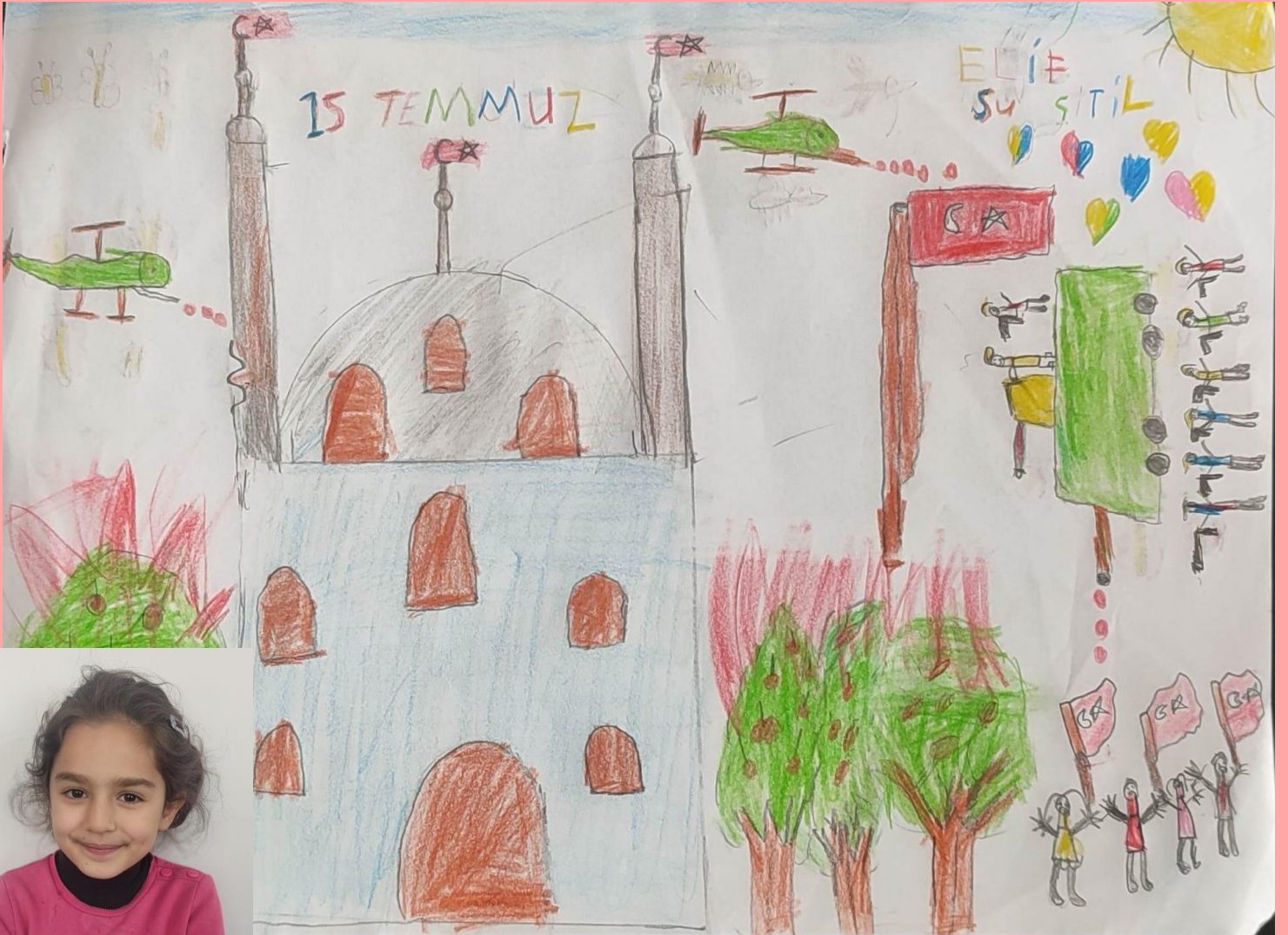
Resim: Elif Su ÇİTİL, 2/A